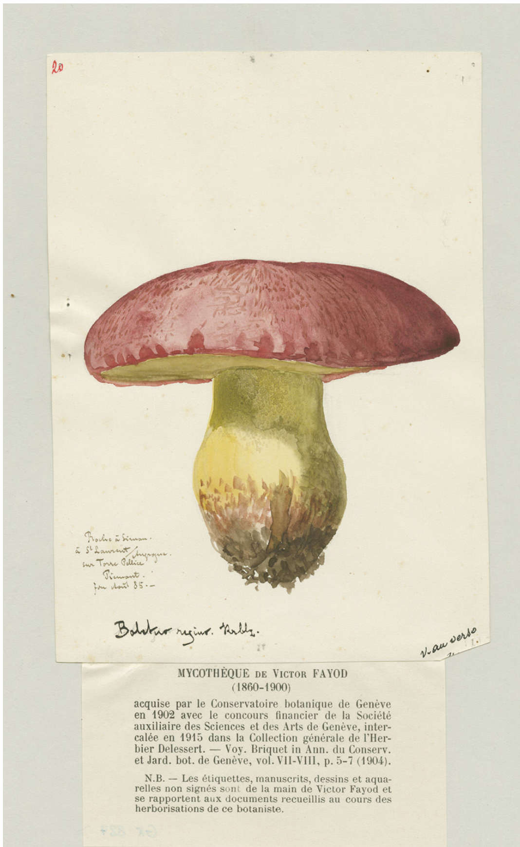
« Bolet Royal » Victor Fayod, Italie, 1860, Aquarelle Conservatoire et Jardin botaniques