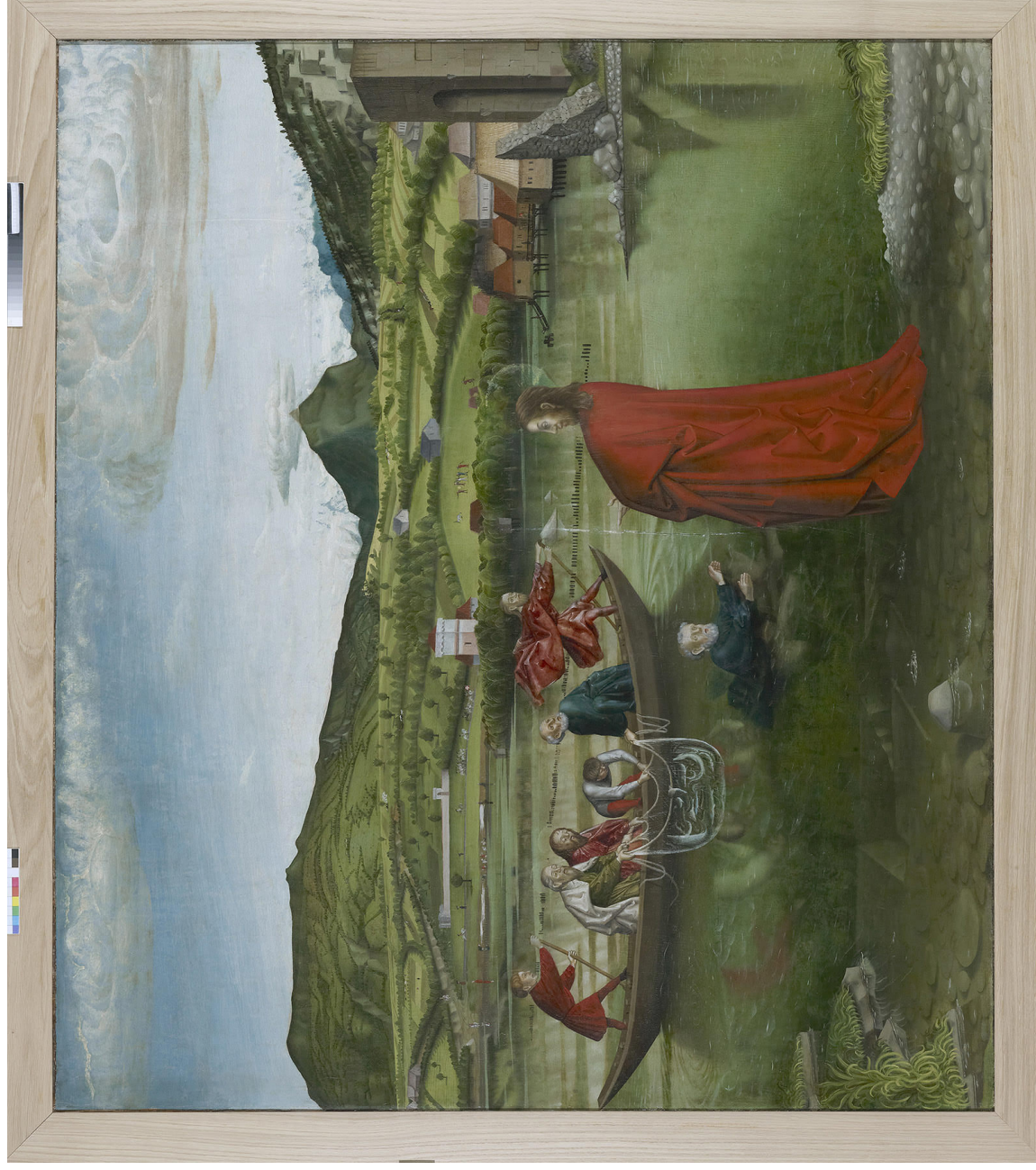
« Pêche miraculeuse » Konrad Witz, Suisse, 1444, Tableau Musée d'art et d'histoire