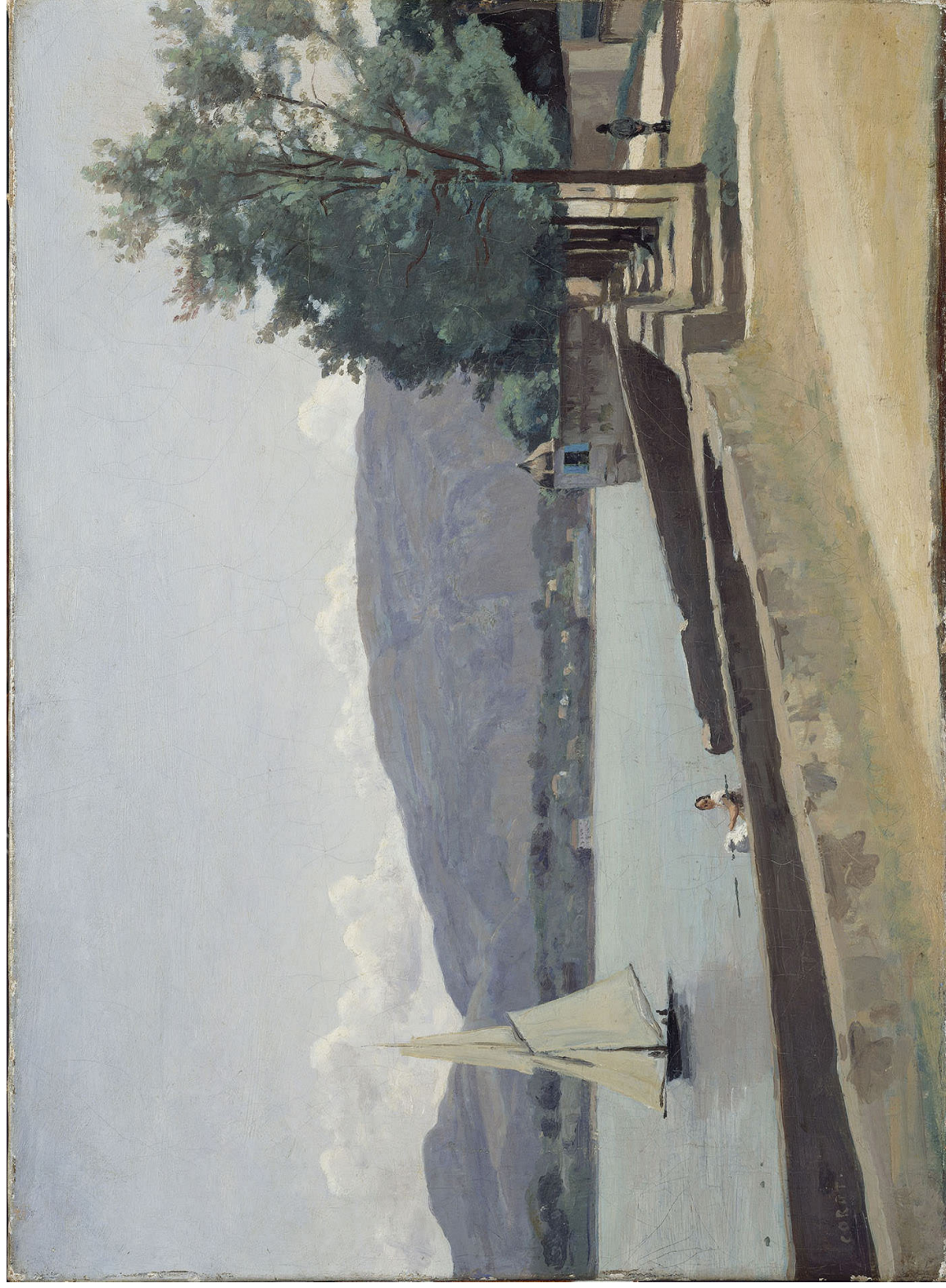
«Le quai des Pâquis» Jean-Baptiste Camille Corot, Suisse, 1842, Tableau Musée d'art et d'histoire

Merveilles des collections de la Ville de Genève