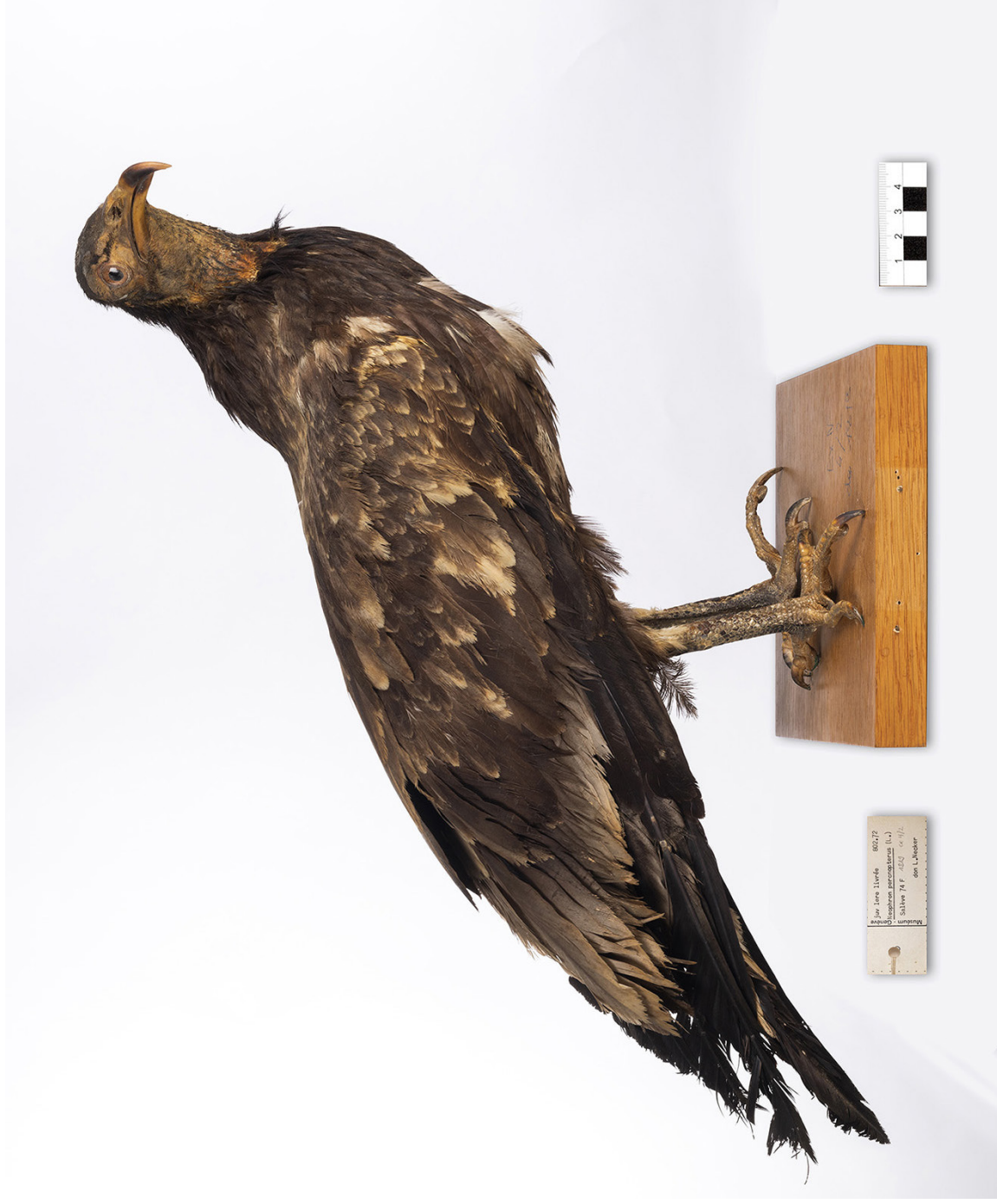
« Vautour percnoptère » Louis Albert Necker, France, 1819, Animal Muséum d'histoire naturelle