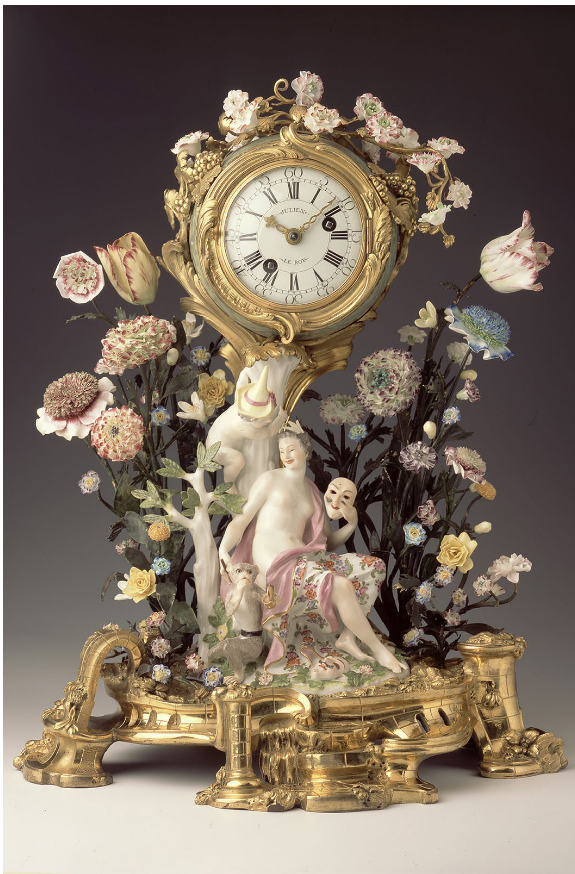
« Pendule de cheminée » Julien Le Roy, Allemagne/France/Chine, 1750-1755, Accessoire Musée Ariana