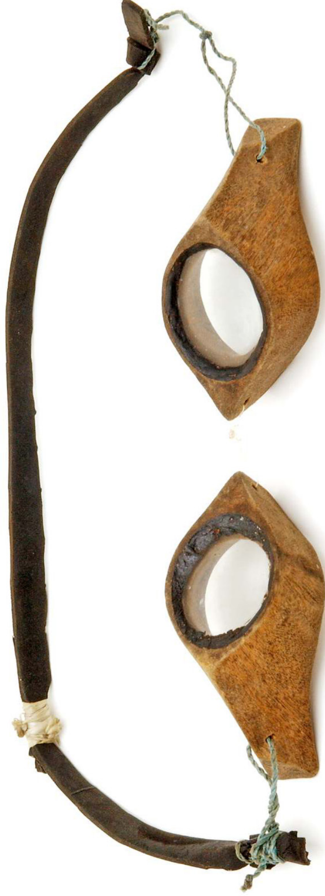
«Lunettes de plongée» Philippines, 1980, Accessoire Musée d'ethnographie de Genève

Merveilles des collections de la Ville de Genève