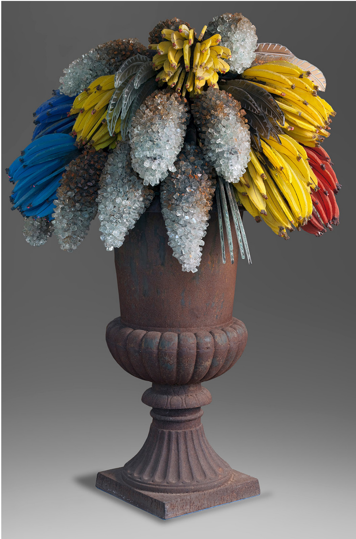
« Bananes et raisins » Marcoville, France, 2006, Sculpture Musée Ariana

Merveilles des collections de la Ville de Genève